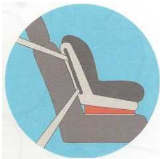
Лицом по ходу движения

Самое безопасное место для установки детского кресла в автомобиле — среднее место на заднем сиденье. Самое небезопасное - переднее пассажирское сиденье. Туда автокресло ставится в крайнем случае, при обязательно отключенной подушке безопасности.