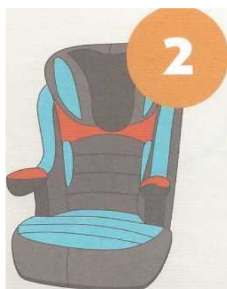
15-25 кг от 3 до 7 лет