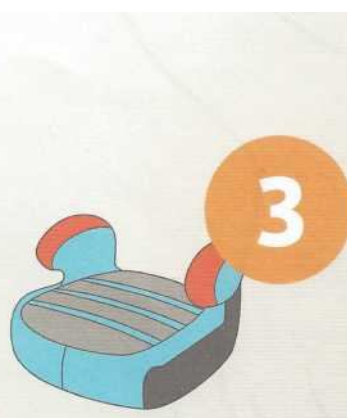
22-36 кг от 6 до 12 лет