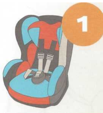
9-18 кг от 9 месяцев до 4 лет