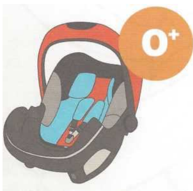
0-13 кг от рождения до 1 года

Покупайте кресло вместе с ребенком. Пусть он попробует посидеть в нем - прямо в магазине.